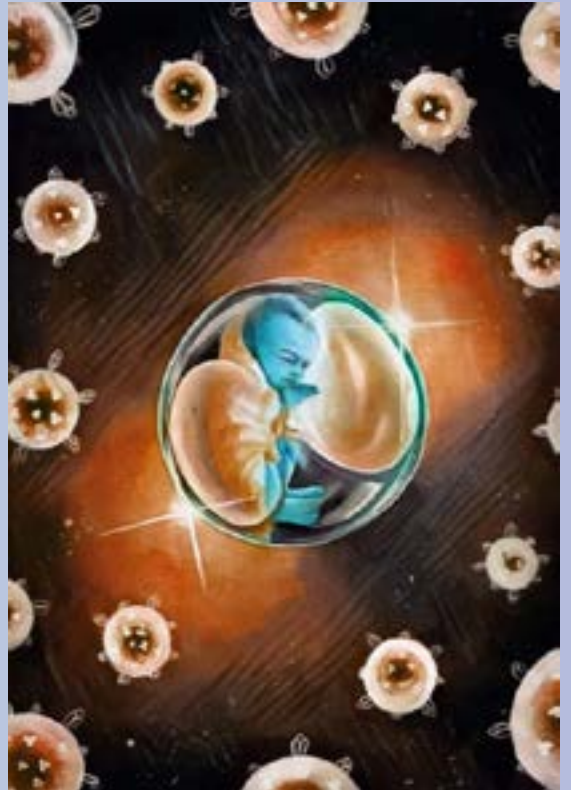
ஓவியம் : ம.ஹரிஹரன், முன்னாள் மாணவர்