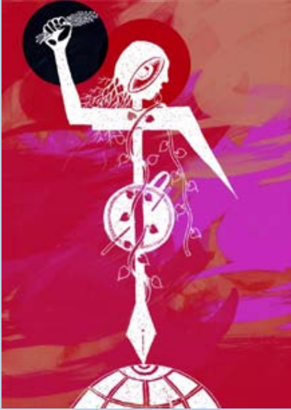
ஓவியம் : புண்டி ஜெயராஜ், ஓவிய ஆசிரியர்