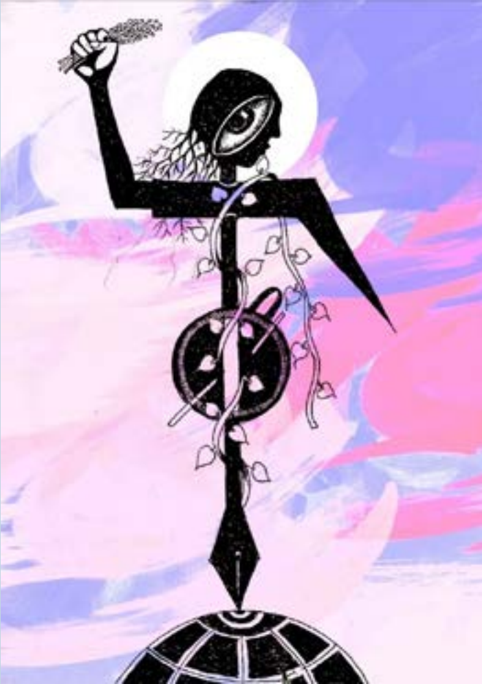
ஓவியம் : புண்டி ஜெயராஜ், ஓவிய ஆசிரியர்