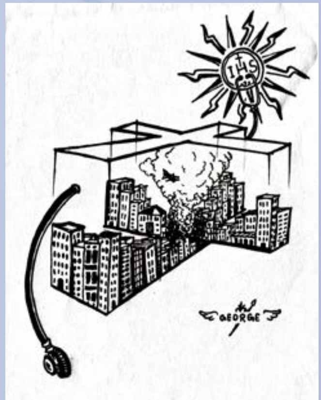
ஒவியம் : ஜா.பெர்னாஸ்டு ஜார்ஜ்ராஜ் , முன்னாள் மாணவர்