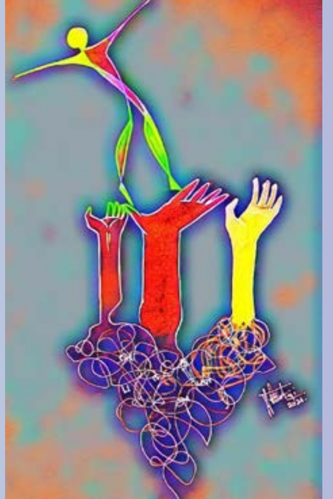
ஓவியம் : ஆ. பாலாஜி XII E