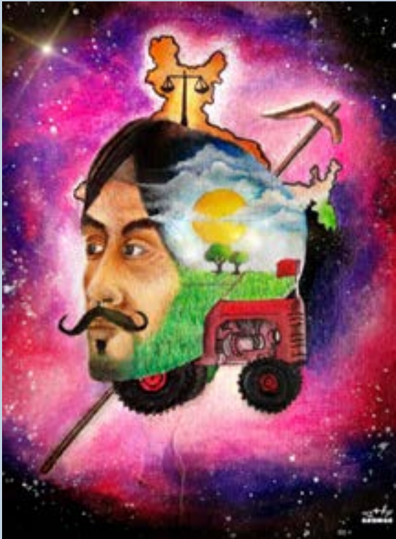
ஓவியம் : ஜா.பெர்னாஸ்டு ஜார்க்ராஜ் , முன்னாள் மாணவர்