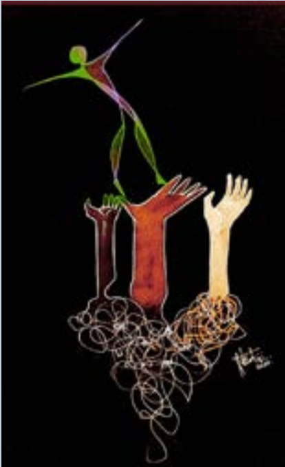
ஒவியம் : பாலாஜி ,XII E