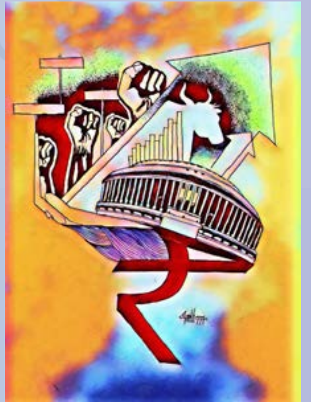
ஓவியம் : கிரா. அஜய் கண்ணன், XII A1