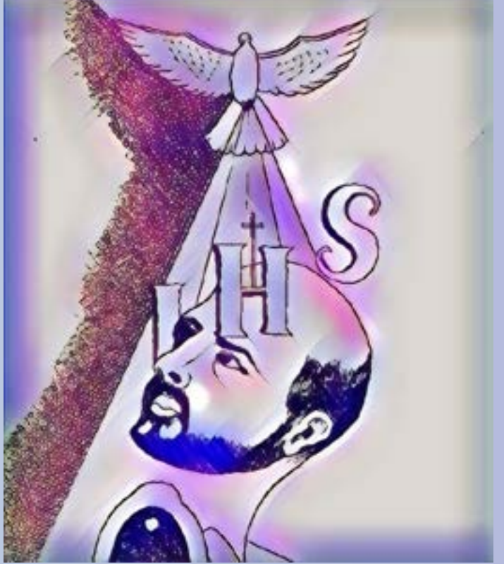
ஓவியம் : இரா. அஜய் கண்ணன் XII A1