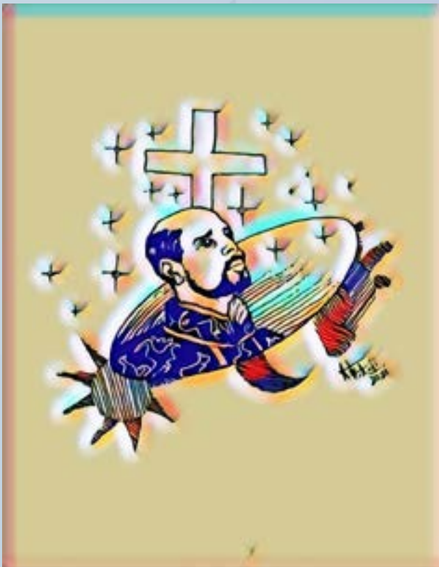
ஒவியம் : பாலாஜி , XII E